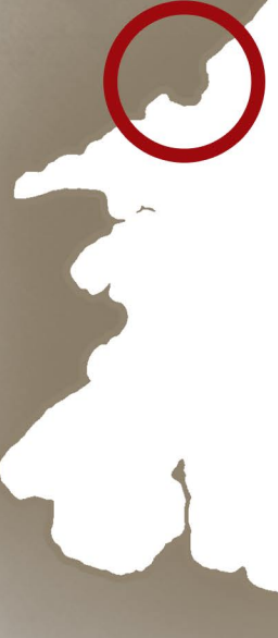
PIANTA PIANO TERRA | 1:200

TOSCOLANO MADERNO LAGO DI GARDA LOMBARDIA ITALIA